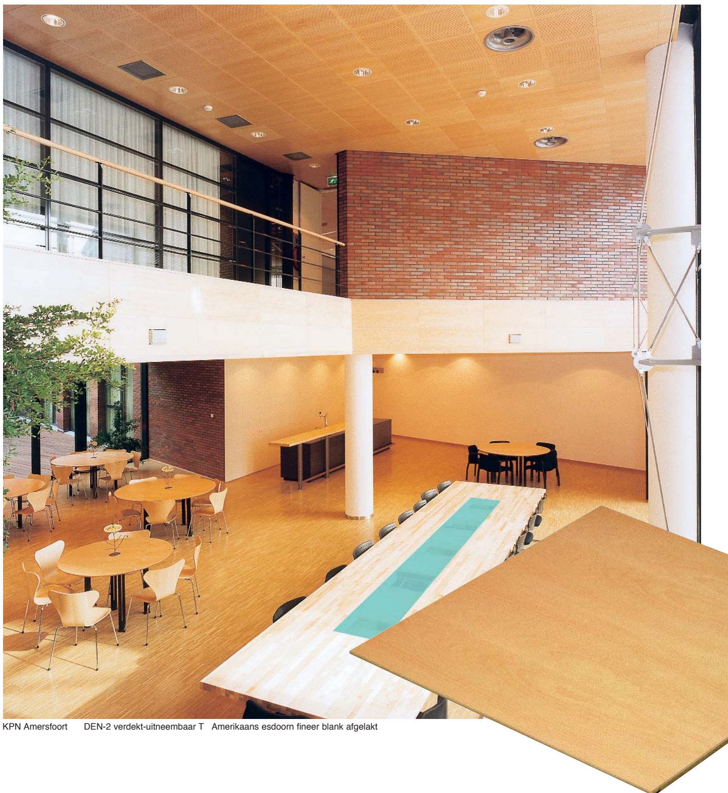
KPN Amersfoort DEN-2 verdekt-uitneembaar T Amerikaans esdoorn fineer blank afgelakt